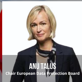
ANU TALUS Chair European Data Protection Board