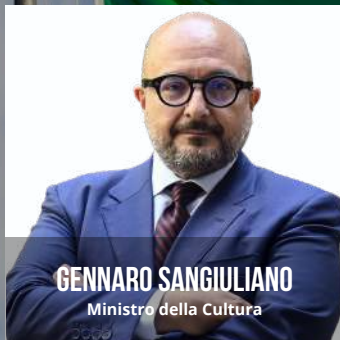
GENNARO SANGIULIANO Ministro della Cultura