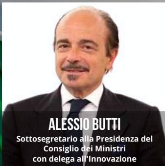
ALESSIO BUTTI Sottosegretario alla Presidenza del Consiglio dei Ministri con delega all'Innovazione