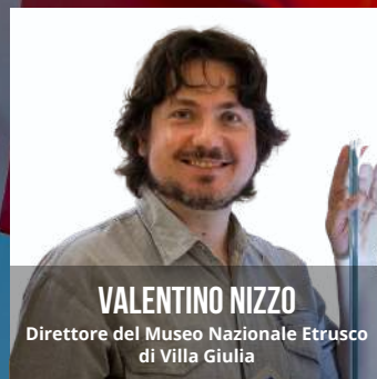
VALENTINO NIZZO Direttore del Museo Nazionale Etrusco di Villa Giulia