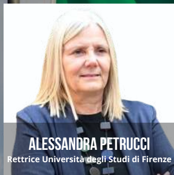
ALESSANDRA PETRUCCI Rettrice Università degli Studi di Firenze