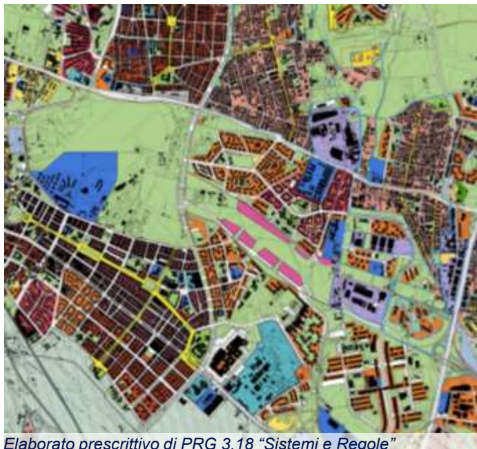
Elaborato prescrittivo di PRG 3.18 "Sistemi e Regole"

La Proprietà ha avviato un confronto con il Comune di Roma, finalizzato alla definizione dello Schema di Assetto Preliminare (SAP), la cui presentazione risulta necessaria al fine dell'approvazione del Progetto Urbano a sua volta propedeutico al proseguimento dello sviluppo edilizio.