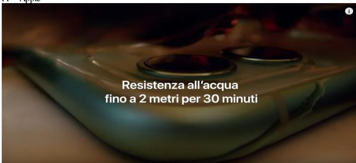
Immagine n. 2 - tratta dal video di cui all'URL https://www.youtube.com/watch?v=Kz_EqbCTs38 - iPhone 11 Pro

Immagine n. 1 - tratta dal video di cui all'URL https://youtu.be/YWnuHYzNJK8 – Nuovo iPhone 11 – Apple