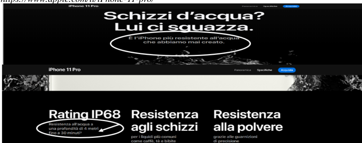
Immagine n. 5 iPhone 11 pro rilevata in data 24 ottobre e 15 novembre 2019 alla pagina web https://www.apple.com/it/iphone-11-pro/ 31

27. Ulteriori messaggi pubblicitari, presenti in altre pagine web del sito Apple, specificamente riconducibili ad alcuni dei suddetti modelli iPhone ( iPhone 11 Pro e iPhone 11 ), esaltano in modo ancor più enfatico la caratteristica circa la collaudata resistenza all'acqua a una determinata profondità dei due prodotti, come si evince dalle immagini di seguito riportate (Immagine n. 5: "È l'iPhone più resistente all'acqua che abbiamo mai creato - Resistenza all'acqua a una profondità di 4 metri fino a 30 minuti"; Immagine n. 6: "Non teme gli schizzi e neanche i tuffi - Resiste al doppio della profondità - iPhone 11 è resistente all'acqua fino a 2 metri per 30 minuti: una profondità doppia rispetto all'iPhone XR").