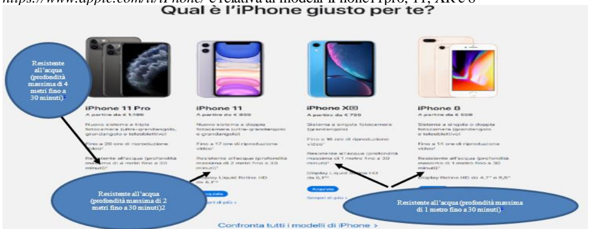
Immagine n. 4 rilevata in data 24 ottobre e 15 novembre 2019 alla pagina web https://www.apple.com/it/iphone/ e relativa ai modelli iPhone 11 pro, 11, XR e 8

26. Alla fine del messaggio pubblicitario può rinvenirsi, in caratteri minuscoli, una nota ipertestuale (indicata dalle frecce nell'immagine precedente), che riporta molto in fondo, al termine della pagina web, il seguente messaggio: “ iPhone 8, iPhone 8 Plus, iPhone XR, iPhone 11 Pro, iPhone 11 Pro Max e iPhone 11 resistono agli schizzi, alle gocce e alla polvere; sono stati testati in laboratorio in condizioni controllate, con un rating di grado IP68 (profondità massima di 4 metri fino a 30 minuti) ”