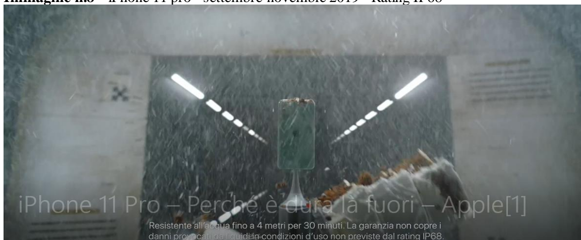
Immagine n.8 – iPhone 11 pro - settembre-novembre 2019 - Rating IP68 37

34. In messaggi pubblicitari successivi, relativi a modelli più performanti di iPhone, veicolati dai professionisti tramite i medesimi canali (TV, TV on line, ecc.), nonostante il grado di protezione del dispositivo risultasse ancora più elevato ( Rating IP68 -apparecchio protetto contro gli effetti della sommersione- resistenza all'acqua per 4 metri fino a 30 minuti ), si rileva la medesima antinomia del messaggio pubblicitario proposto ai consumatori derivante dalla enfaticata capacità di resistenza all'acqua e la contestuale negazione dell'assistenza in garanzia, per danni provocati da liquidi (vedi successiva immagine n. 8).