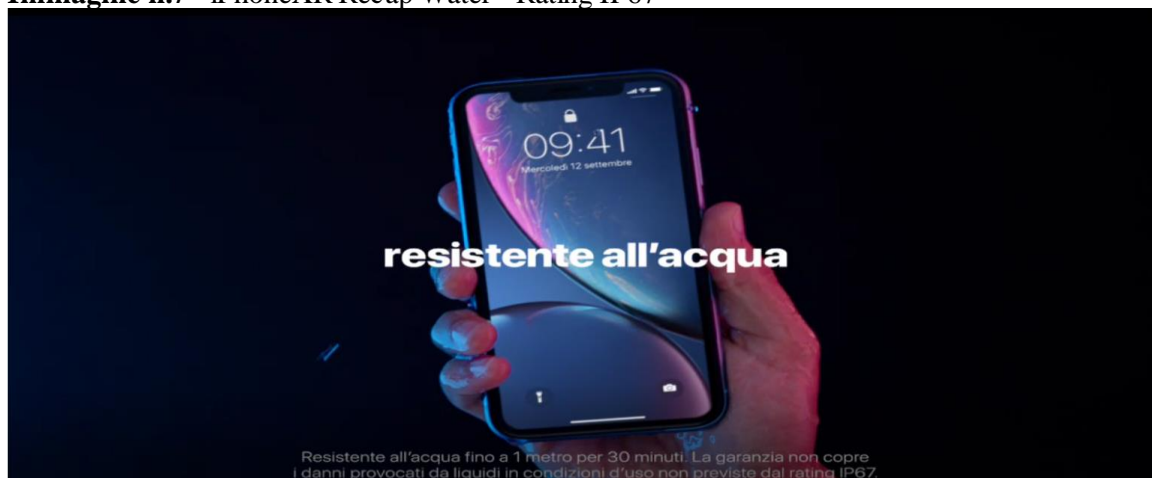
Immagine n.7 - iPhoneXR Recap Water - Rating IP67

34. In messaggi pubblicitari successivi, relativi a modelli più performanti di iPhone, veicolati dai professionisti tramite i medesimi canali (TV, TV on line, ecc.), nonostante il grado di protezione del dispositivo risultasse ancora più elevato ( Rating IP68 -apparecchio protetto contro gli effetti della sommersione- resistenza all'acqua per 4 metri fino a 30 minuti ), si rileva la medesima antinomia del messaggio pubblicitario proposto ai consumatori derivante dalla enfaticata capacità di resistenza all'acqua e la contestuale negazione dell'assistenza in garanzia, per danni provocati da liquidi (vedi successiva immagine n. 8).