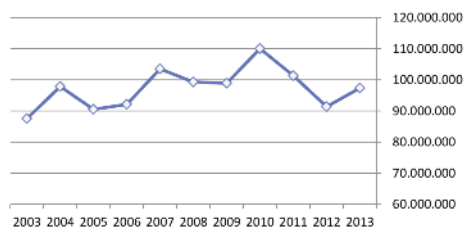
Fig. 20) Presenze intero mercato 2003-2013

Fonte: Elaborazione Unità di Studi congiunta DG Cinema/ANICA su dati Cinetel