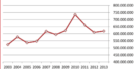
Fig. 19) Incassi (€) intero mercato 2003-2013

Fonte dell'elaborazione: Sintesi dati Cinetel (anni 2011-2013) a cura di ANEM-Associazione Nazionale Esercenti Multiplex, ANEC-Associazione Nazionale Esercenti Cinema, ANICA-Associazione Nazionale Industrie Cinematografiche Audiovisive e multimediali, e SIAE-Società Italiana degli Autori ed Editori (Roma, 2014).